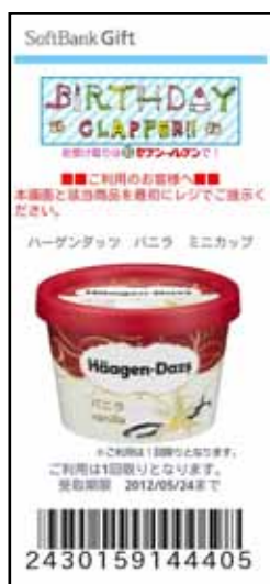
商品引換え用のバーコードが表示される。 これをコンビニエンスストアにて提示する。