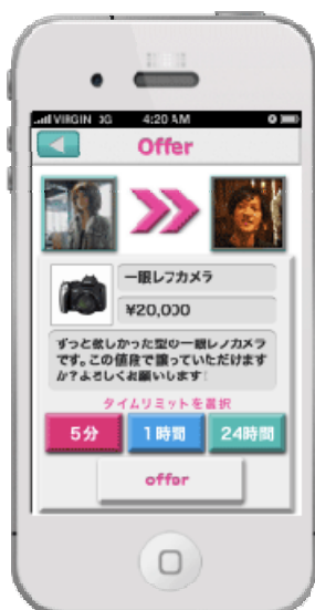
買手から取引条件を提示し交渉する