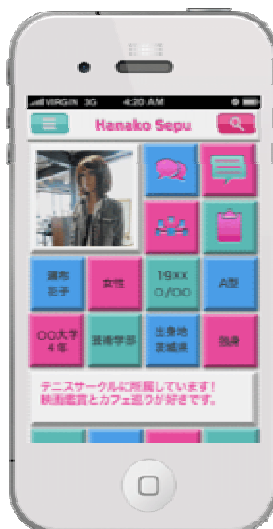
各ユーザーの情報を確認する