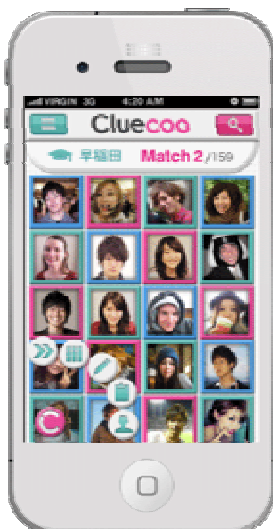
取引可能なユーザーが表示される