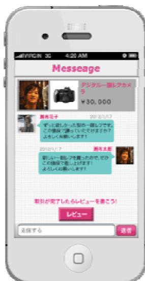
取引成立後、メッセージをやり取りして 受渡し場所などを決定する

「Android」及び「Google Play」は、Google Inc.の商標または登録商標です。